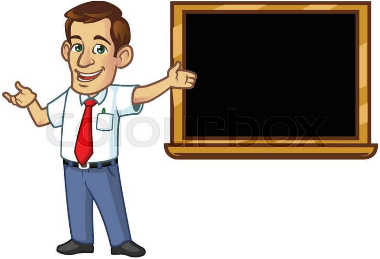
Finlandiya eğitim sistemi ppt slayt

Eđitim sistemimizi herkes kendi bakış açısı dođrultusunda eleřtirmektedir. Başarımızın dünya çapında düşük olduđunu görmekteyiz. Uzun yıllardır dünya genelinde yapılan çalışmalarla ise Finlandiyalı öğrenciler ilk sıralarda yer almaktadır. Peki Finlandiya öğrencilerini ilk sıraya çıkarmayı nasıl başarmıştır?