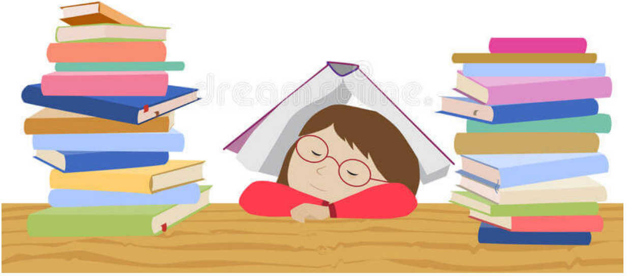
Finlandiya eğitim sistemi sınavları