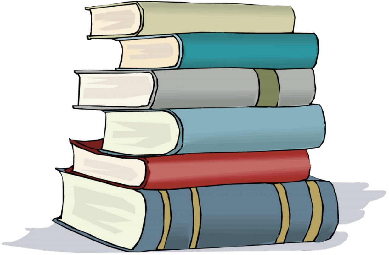
Finlandiya eğitim sistemi kitapları